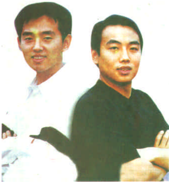
中国乒乓球队总教练蔡振华：对手强劲难囊括

1996年，在亚特兰大奥运会上，中国乒乓球队夺得了4枚金牌。无疑，球迷们都希望我们在悉尼也能保持这个好成绩。但从形势上讲，我们面临着比上届奥运会更加严峻的考验。