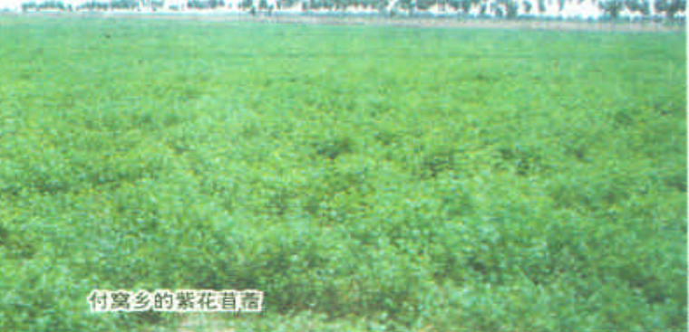
付窝乡的紫花苜蓿

牲畜,到放牧牛羊;从打柴生火、到建造房屋;从手工编织,到机器加工……勤劳而智慧的黄河口人依靠“野火烧不尽,春风吹又生”的草,使自己的生活更加富足,更加完美。利津人有句颇具调侃意味的话叫做“嚼咄咄的李鲍庄,不透气的鲍王庄”,说的是这两个同处一个乡镇的村子的“祖业”。从前,李鲍庄世代做鞭炮,鲍王庄则是世代用草编织履帽,“不透气”实际上是在用一种夸张的语言形容他们制作的履帽质量之好。在黄河三角洲上,从前世代以草编为业的村庄绝不在少数,就地取材,家庭产业,因陋就简却又各有千秋。只是近年来随着第三产业的不断发展,相对于商业经营的高速度、高效率,传统手工编织回报率相对低,一些人才对此失去了从前的兴趣。不过,有着这种作业传统的黄河口人一旦发现自己所拥有的传统工艺能够出口创汇,复兴这类产业并不困难。